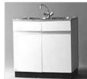
38051 Mietspüle (Abbildung ähnlich)