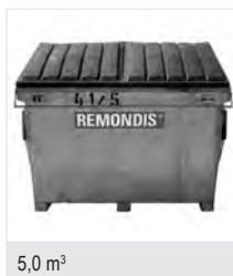
5,0 m 3

Bitte beachten Sie bei der Befüllung der Container, dass die Containerdeckel noch komplett schließbar sein müssen.