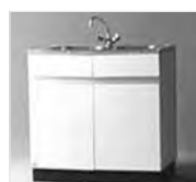
38051 Mietspüle (Abbildung ähnlich)